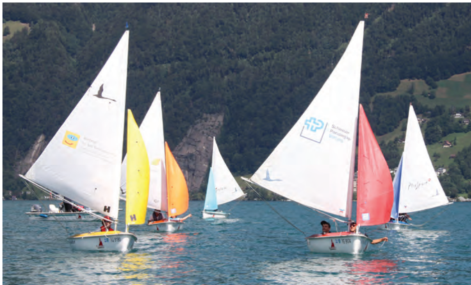
Etappe um Etappe eroberten die Segelnden den Vierwaldstättersee.