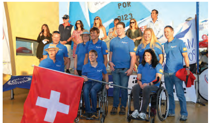
Die Teilnahme an der Hansa European Championship 2019 im portugiesischen Portimao war für das Regatta-Team ein Erlebnis.